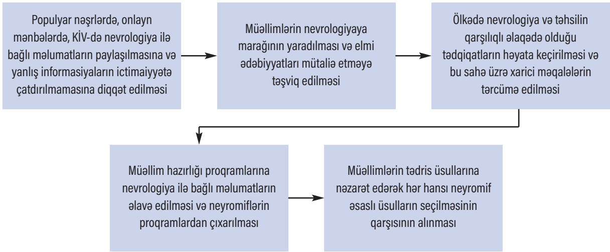
Cədvəl 3 Neyromiflərin yaranması və müəllimlər arasında yayılmasına qarşı tədbirlər

davranırlar. Belə ki, ibtidai sinifdə şagirdlər onlara verilən fəaliyyətləri sığulmadan icra etməyə daha meyilli olsa da, yuxarı siniflərdə aktivlik maraq dairələri üzrə dəyişir. Məsələn, riyaziyyat üzrə həvəsi olan bir şagird marağının olmadığı təbiət elmləri üzrə dərslərdə passiv ola bilər. Belə olduqda şagirdin sadəcə riyaziyyatı daha çox sevməsinə görə onun sol beynini daha aktiv işlətdiyini iddia etmək doğru olmaz. Həmin şagird sağ beynlə əlaqələndirilən incəsənətdə də uğurlu ola bilər. Ona görə də tədris prosesi planlaşdırılarkən yuxarıda qeyd edilən nüansları nəzərə almaq tövsiyə edilir.